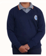
Pull en laine