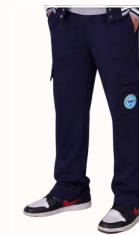
Pantalon cargo fluide