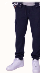
Pantalon cargo normal