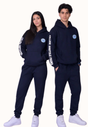
Sweat à capuche