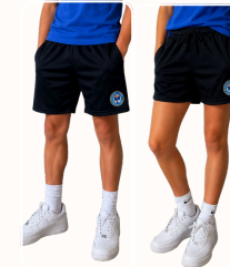
Short de sport