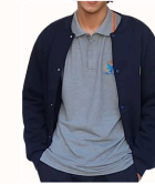
Veste en molleton