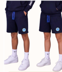
Short en coton